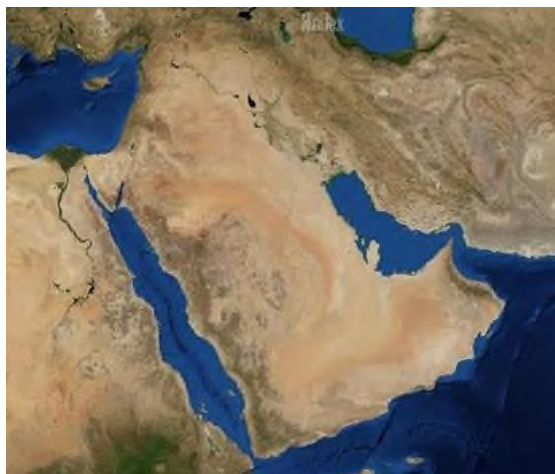
Рисунок к заданию 4 – Самый крупный полуостров мира

На космическом снимке представлен самый крупный по площади полуостров мира. Определите этот полуостров и ответьте на вопросы в таблице.