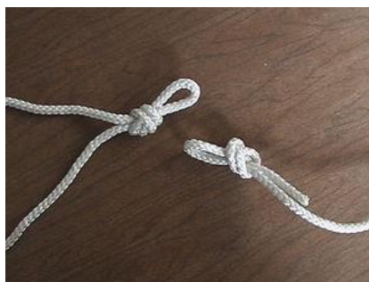
Вариант 1. Узел «ПРОВОДНИК»