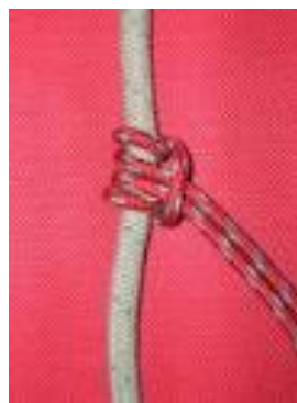
Вариант 6. Узел «СХВАТЫВАЮЩИЙ» (классический)