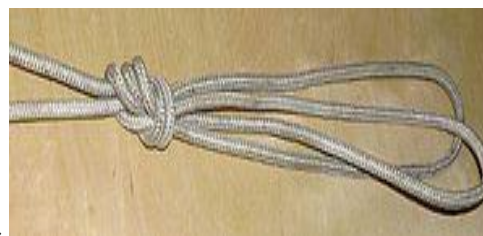
Вариант 5. Узел «ДВОЙНОЙ ПРОВОДНИК» («ЗАЯЧЬИ УШИ»)