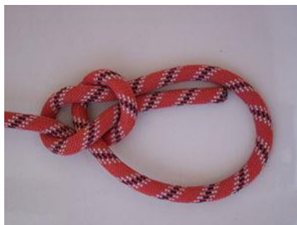
Вариант 2. Узел «БУЛИНЬ»