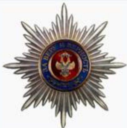
Орден Святого апостола Андрея Первозванного

Задание 3. Еще в древние времена люди, выражая признательность отдельным членам своего общества за отличия и смелость, разрешали самым достойным носить символы охотничьего мастерства – звериные клыки, шкуры. В современное время за проявленный героизм, за заслуги, за успешное руководство, граждане Российской Федерации награждаются медалями и орденами. Выполните задание, заполните правую часть столбца таблицы напротив каждого рисунка, указав наименование медали или ордена.