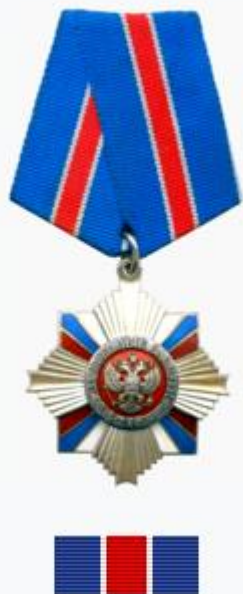
Орден «За военные заслуги»