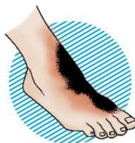
III–IV степень – обугливание кожи и тканей (до кости)