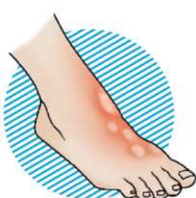
II степень – образование пузырей на коже