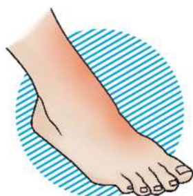
I степень – покраснение кожных покровов