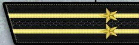
Капитан 2 ранга