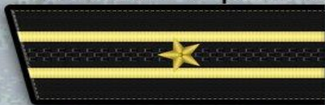
Капитан 3 ранга