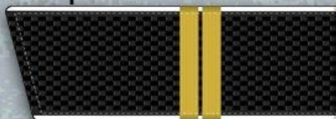
Старшина 2 статьи