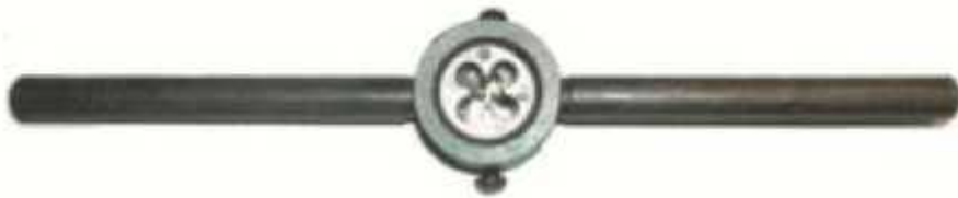
Образец ручек плашкодержателя