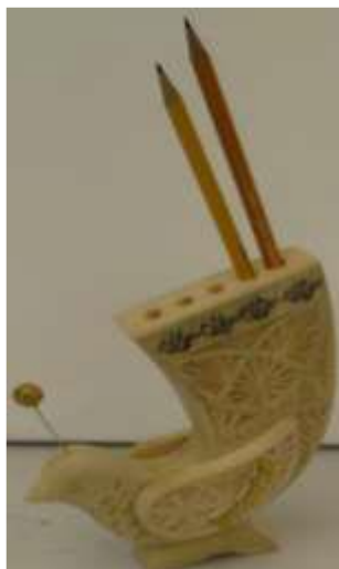
Рис.1. Образец декоративной подставки