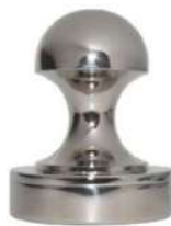
Рис. 1. Образец ручки для металлического шкафа

Примечание. Учитывается вид финишной отделки и дизайн готового изделия.