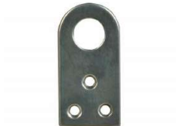
рис. 1. Элемент подвески (ушко)

Конструирование и изготовление элемента подвески (ушка), изображенного на рис. 1.