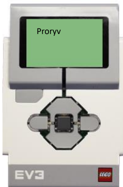
Рисунок 2. Пример вывода информации