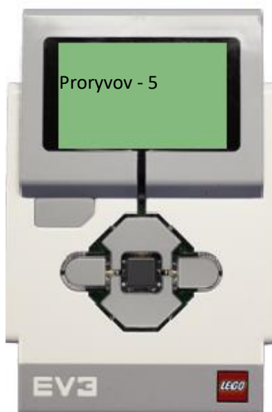
Рисунок 3. Пример вывода информации по окончании работы робота