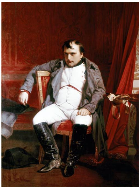
Наполеон Бонапарт 1806. Поль Ипполит Деларош

Задание 1. Перед Вами два портрета Наполеона, написанные в разное время его правления.