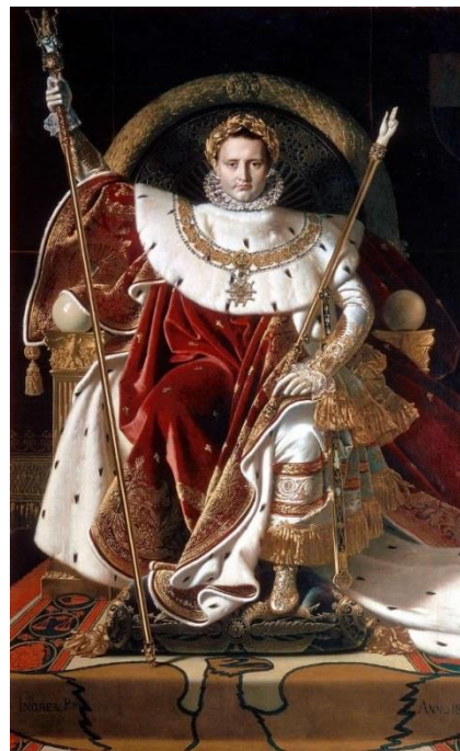
Наполеон на императорском троне. 1806 Доминик Энгр