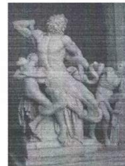
Агесандр, Афинодор, Полидор (40 г. до н.э.)

Внимательно рассмотрите представленную скульптурную композицию; прочитайте стихотворение, посвященное легендарному событию.