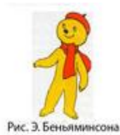
Рис. Э. Беньяминсона