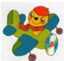
Рис. В. Дмитриюка