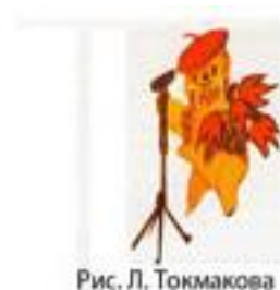
Рис. Л. Токмакова