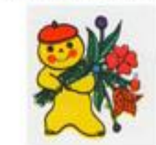
Рис. В. Хлебниковой