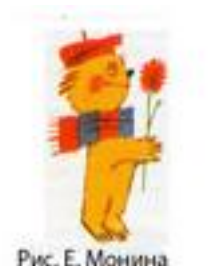
Рис. Е. Монины