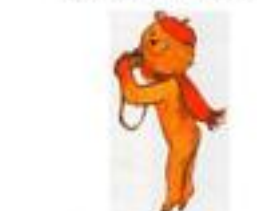
Рис. Б. Диодорова