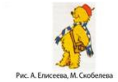
Рис. А. Елисеева, М. Скобелева