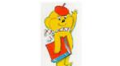
Рис. В. Чижикова