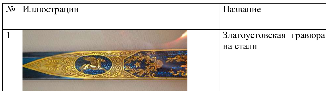
Таблица к заданию

Хохломская роспись; Златоустовская гравюра на стали; Тагильский расписной поднос; Каслинское художественное литье.