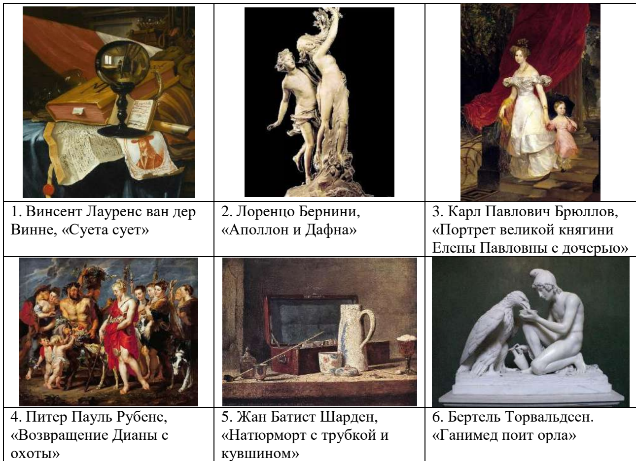
Таблица 1 к заданию. Разбивка на 2 группы.

Задание 2. Даны названия и изображения картин. Их можно разбить на 2 и на 3 группы. Предложите свои варианты разбивки. Дайте название каждой группе.