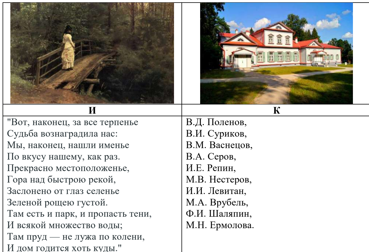
Таблица для ответа: