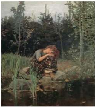
В.М. Васнецов. 1888. Сестры-змеи. 175 x 122. Музей-квартира С.П. Дягилева, Москва.