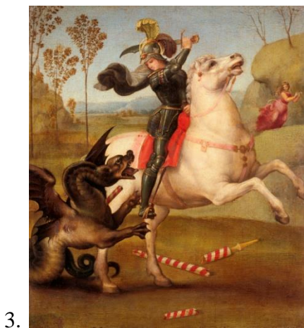
Таблица к заданию 5