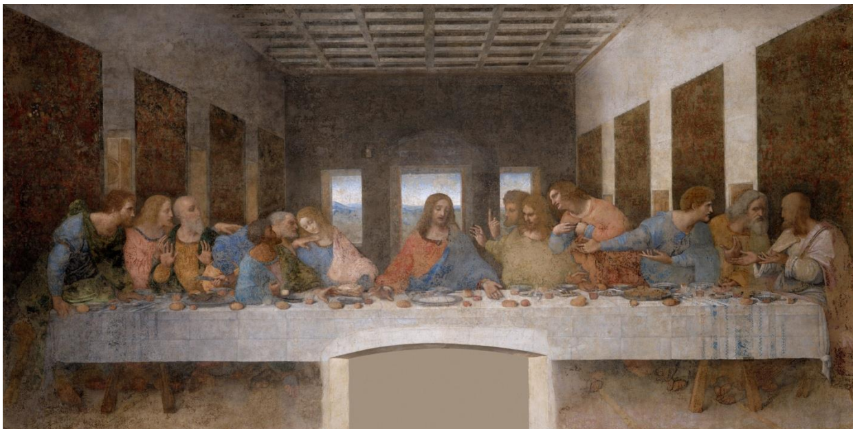
Леонардо да Винчи «Тайная вечеря». 1495-1498. Монументальная роспись. 460 × 880 см. Церковь Санта-Мария-делле-Грацие, Милан.