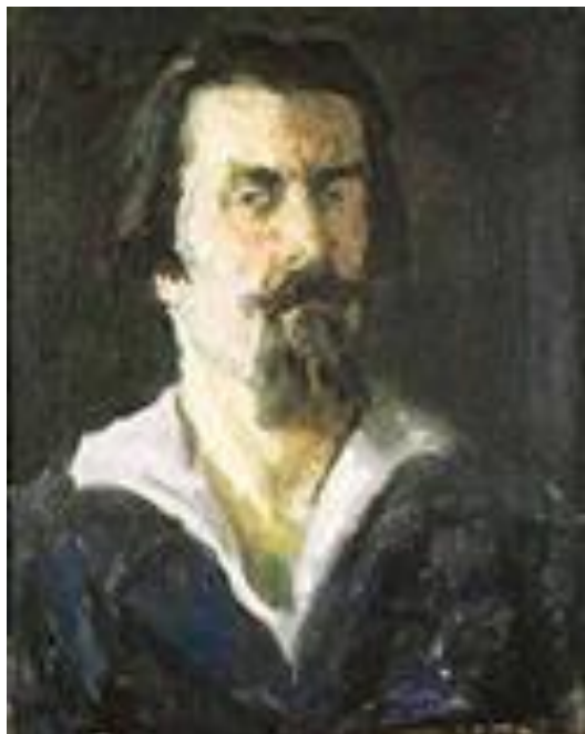
Автопортрет 1935 год