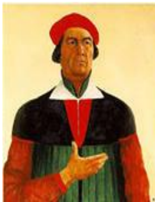
Автопортрет 1933 год