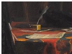
Бумаги на столе и рука Алексея