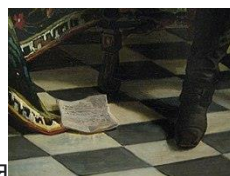
Бумага, упавшая на пол