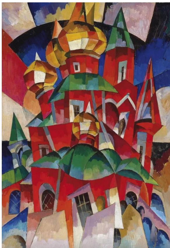
Иллюстрация № 3 «Красная церковь»