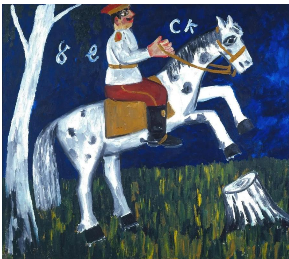
Иллюстрация № 4 «Солдат на коне»