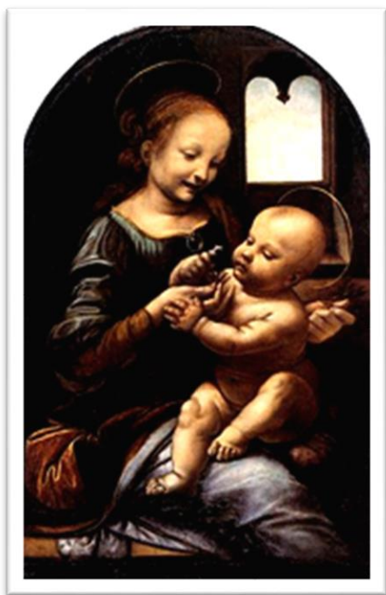
6. Тайная вечеря. 1495—1498 гг.