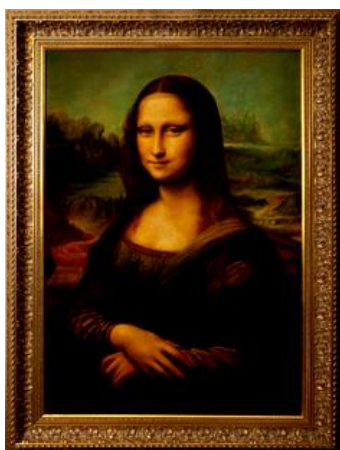
1. Мадонна Бенуа. Ок. 1478—1480 гг.