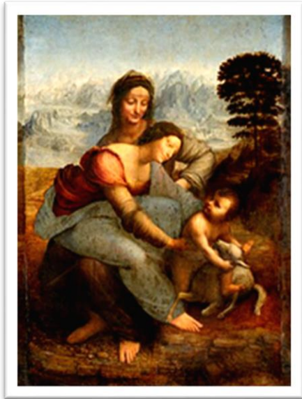
3. Портрет госпожи Лизы дель Джокондо. 1503—1519 гг.