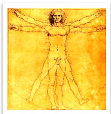
2. Мадонна Литта. 1490—1491гг.