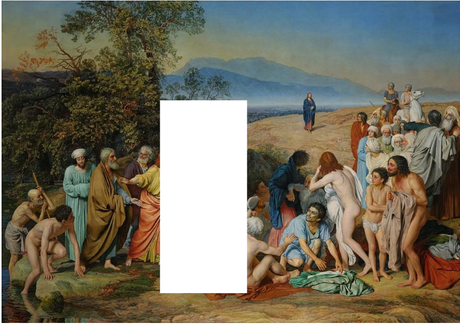
2. Утрачено изображение