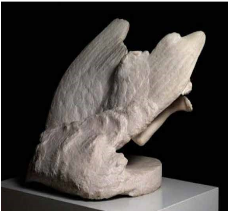
Огюст Роден. «Иллюзия – сестра Икара» (1894–1896)