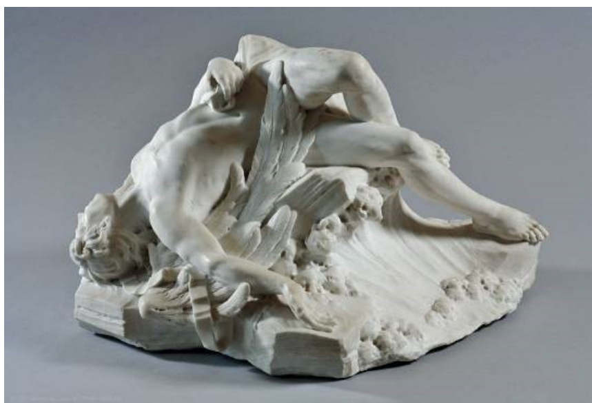
Поль Амбруаз Слоттц. «Мёртвый Икар» (1743)

Опираясь на эти вопросы и свои наблюдения, напишите небольшое рассуждение (80–100 слов) на тему «Образ Икара в скульптурах П.А. Слоттца и О. Родена».