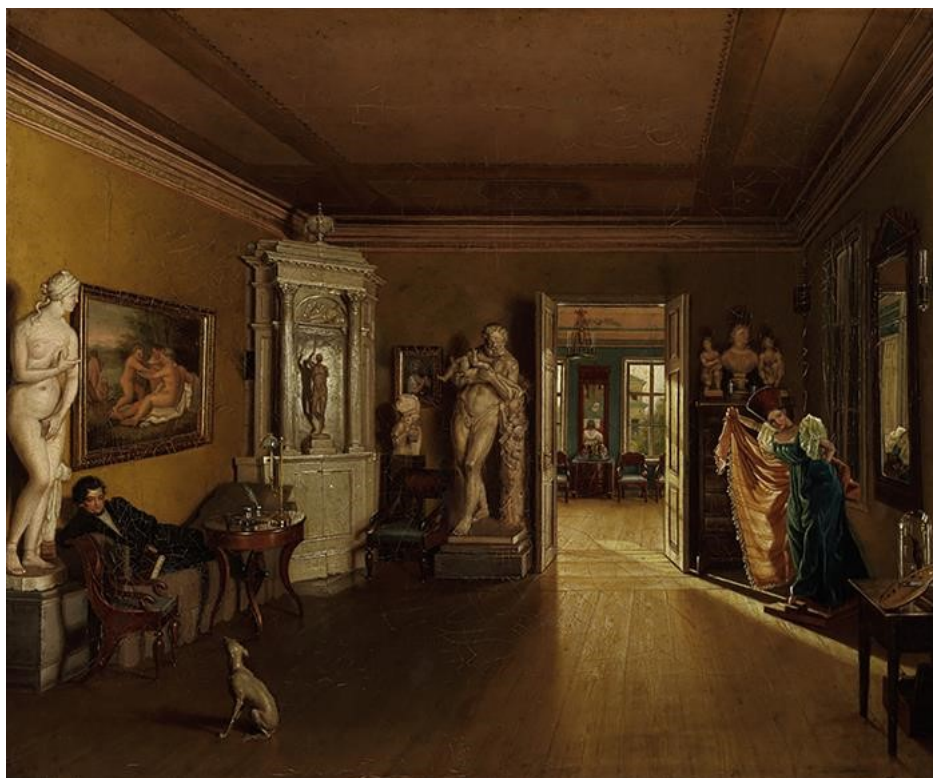
Художники школы Венецианова. Ф. Славянский. Кабинет художника Алексея Гавриловича Венецианова. Конец 1830-х – начало 1840-х годов