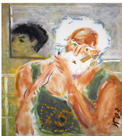
И. Голицын. Автопортрет. 2003

Посмотрите на работы, представленные в задании, и разбейте их на три группы: произведения художников школы Венецианова, картины Жуковского и работы Голицына. В этом Вам помогут «образцы» – подписанные работы художников, в которых ярко проявились особенности художественного почерка каждого.